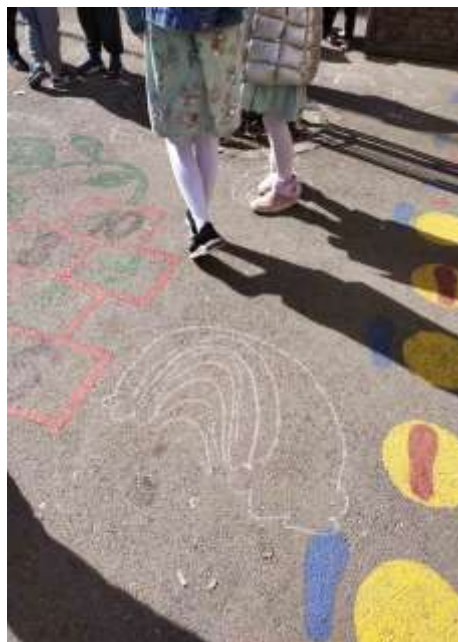
Четврти дан активности „Исти а различити „ боја облачења плава.